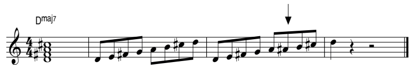
Afbeelding 4.5 arpeggio DMaj7, toonladder D majeure en bebopladder

Op DMaj7 gelden dezelfde principes als op EbMaj7. Je moet het alleen nog even transponeren. De chromatische basislick voor D-majeur ken je al. De majeurladder en bebopladder bij DMaj7 zijn: