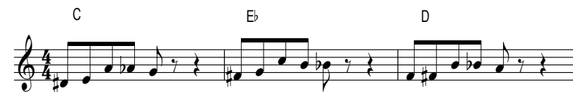
Afbeelding 4.4 chromatische basislick voor C-majeur, Eb-majeur en D-majeur

De chromatische basislick voor mineur ken je al. Deze lost via leidklanken op naar de terts. In majeure is er ook zo'n chromatische basislick. Deze lost op naar de kwint. De eerste noot is een leidklank naar de grote terts. Aansluitend lossen twee leidklanken naar beneden op naar de kwint. In de afbeelding zie je chromatische basislick voor CMaj7, EbMaj7 en DMaj7. Als je steeds de eerste vier noten speelt op je instrument en dan vooruit hoort wat de volgende noot zou moeten zijn, kom je bij de kwint uit.